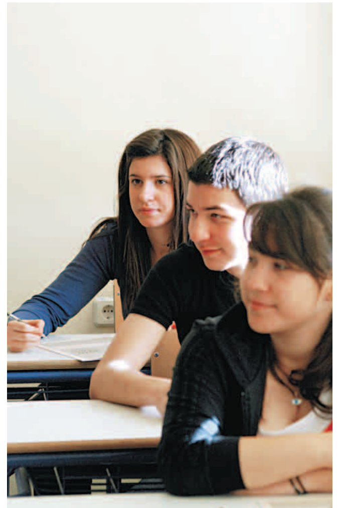
Στις φετινές πανελλήνιες, που θα αρχίσουν στις 12 Μαΐου, έχουν δηλώσει συμμετοχή συνολικά 116.410 υποψήφιοι.

Σύμφωνα με απόφαση του υπουργείου Παιδείας, αν ο υποψήφιος αντιγράφει κατά τη διάρκεια της εξέτασης από το βιβλίο ή από σημειώσεις, ή από το «τετράδιο» άλλου εξεταζόμενου, απομακρύνεται από την αίθουσα και το γραπτό του μηδενίζεται. Το ίδιο ισχύει αν ο υποψήφιος θορυβεί ή δεν υπακούει στους επιτηρητές.